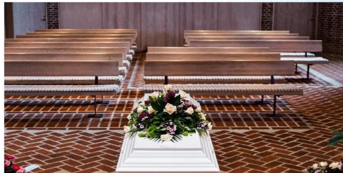
Den fattigste del af danskerne bliver lagt i kisten 10 år tidligere end den rigeste del af danskerne.

Kløften mellem de bedst stillede og de dårligst stillede bliver større og større i sundhedssystemet, viser DR-dokumentar, der bliver vist i morgen aften.