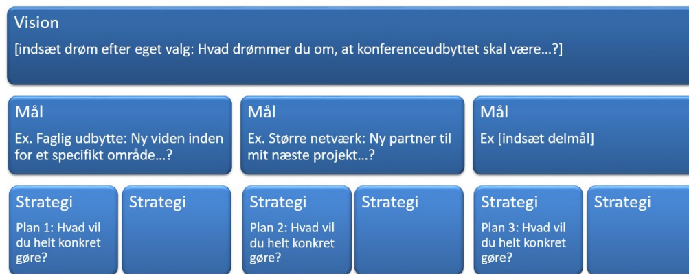
Figur 1. Visionstavlen

Du kan overveje nedenstående seks spørgsmål og forslag, når du skal udfylde visionstavlen og selv finde på flere. Du kan også hente inspiration i afsnittene "Under konferencen", "Efter konferencen" og sætte dine egne svar ind i en tom skabelon, som du finder til sidst i guiden.