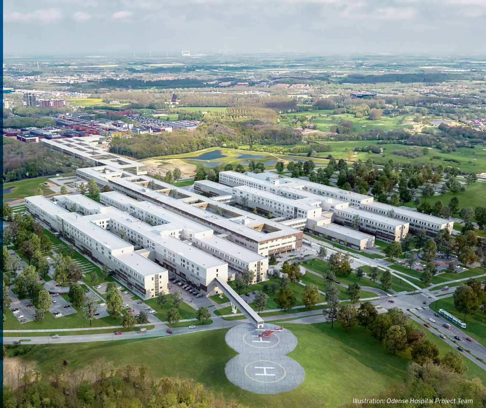
Illustration: Odense Hospital Project Team